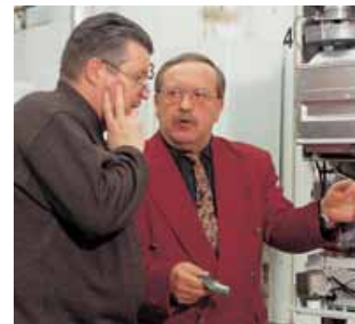
Beratung bei Technikfragen