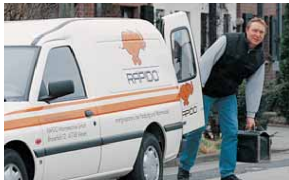
Kundendienst vor Ort